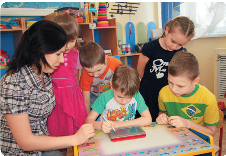
Выполнение задания в электронном учебнике

Банк электронных образовательных ресурсов МДОУ «Детский сад № 23» постоянно пополняется. Педагоги регулярно обновляют и добавляют новые ссылки, разрабатывают мультимедийные материалы по дополнительным темам, возрастным категориям. Увеличивается количество презентаций, игр, авторами которых также являются педагоги. Начата разработка материалов для работы с детьми, имеющими ограниченные возможности здоровья. Все это способствует повышению уровня ИКТ-компетентности педагогического коллектива и качества образовательной деятельности ДОО.